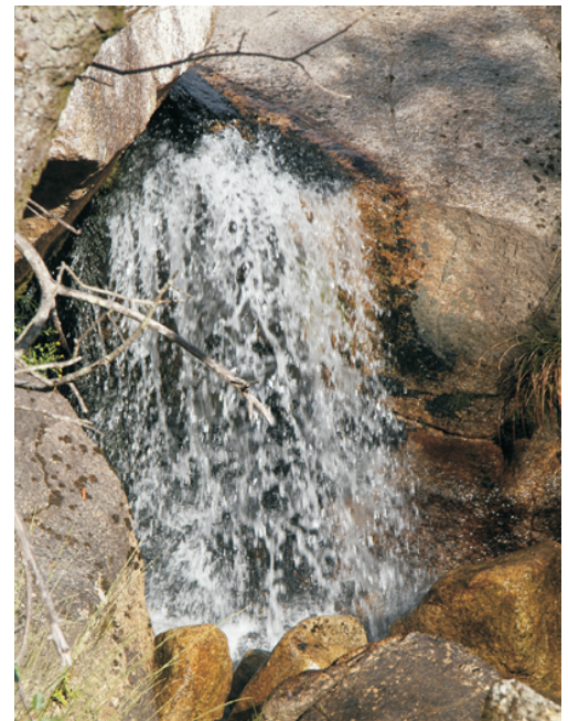
Ferverza en Fontenova.