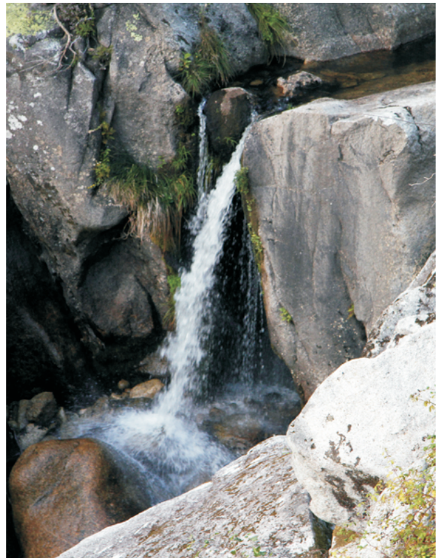
Ferverza en Arrotea.

Seguimos ata a ponte e alí podemos ver as fervezas, mesmo debaixo da ponte e un pouco máis abaixo.