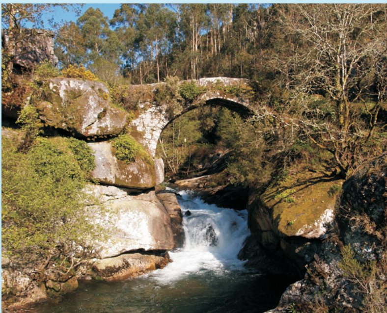
Ferverza debaixo da ponte do Almofrei