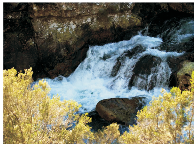
Ferverza en Ponte Arrotea.